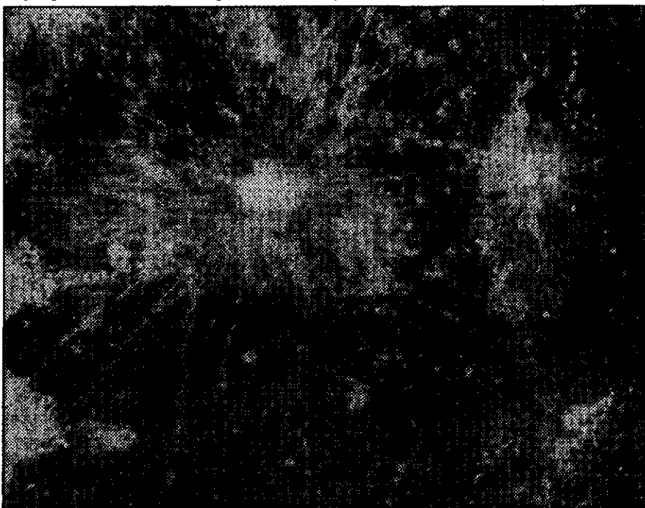
Obr. 1 - Známá trojice kráterů Koperník, Kepler a Aristarchus

Naši prohlídku nemůžeme začít jinak, než kráterem Tycho, který