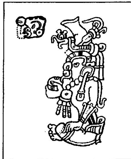
Obr. 2 - Xaman Ek, bohyně Polárky

Náboženství starých Mayů nebylo původně tak krvežíznivé, jak ho našli španělští dobyvatelé. Původní náboženství klasického období sice obsahovalo rituály obětování lidí, ale k obětem docházelo patrně velmi zřídka. Lidské oběti v klasickém období zavedli až Toltékové v poklasickém období.