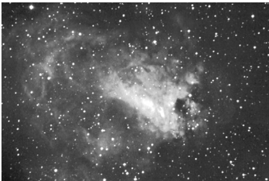
Mlhovina M17 – Omega

Procházku po jednotlivých objektech zahájíme otevřenou hvězdokupou M7 , která je nejjihnějším objektem zařazeným do Messierova katalogu. Při deklinaci téměř -35 stupňů na ní už můžeme pozorovat rozdíly v zeměpisné šířce mezi severní a jižní částí naší republiky. Trochu vyšší kopec, les, či jiná překážka nad jímhem ovšem může plány na její pozorování zcela zhatit. Z jižnějších šířek ji lze bezpečně spatřit pouhým okem – aby ne, když obsahuje řadu hvězd okolo páte a šesté velikosti. Od nás se většinou ukáže až v triedru jako docela pěkné kruhově symetrické uskupení hvězd, při zaprášené atmosféře spíše jako velká zrnitá skvrna. Proto – také vzhledem k tomu, že její střední část je poměrně bohatá na slabší hvězdy – není (ani při jejím průměru okolo jednoho stupně) od věci vzít si na pomoc větší dalekohled se širokouhlým okulárem. Najít ji lze snadno