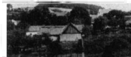
Pohled na kopec Manda z Ondřejova v roce 1899.