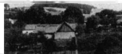
Pohled na kopec Manda z Ondřejova v roce 1899.

Bohužel, originál této kupní smlouvy čili zakládací listiny hvězdárny dnešní Astronomický ústav Akademie věd ČR nevládní. Ve Fričově archivu, který byl rodinou Fričů v r. 1971 předán hvězdárně, tato kupní smlouva nalezena nebyla. S blížícím se 100. výročím založení hvězdárny jsme si tento nedostatek stále více uvědomovali a tak jsme se začali pít alespoň po nějakém jejím opisu nebo kopii. Nejprve jsme se obrátili na obecní úřad v Ondřejově, který musel tehdy opis této smlouvy vlastnit. Tam jsme se dozvěděli, že všechny staré doklady byly předány okresnímu muzeu, ale tam se opis kupní smlouvy nalézt nepodařilo. Pak jsme se obrátili na katastrální úřad okresu Praha - východ, kde jsme se dozvěděli, že v r. 1898 patřil Ondřejov pod okres Kostelec nad Černými lesy, jehož archiv, po zrušení tohoto okresu, byl předán katastrálnímu úřadu v Kolíně, protože většina bývalého okresu Kostelec připadla ke Kolínu. A tak konečně tam na katastrálním úřadě v Kolíně byl nalezen opis kupní smlouvy z 21. ledna 1898 na koupi pozemku na kopci Manda továrníkem J. J. Fričem od obce Ondřejov.