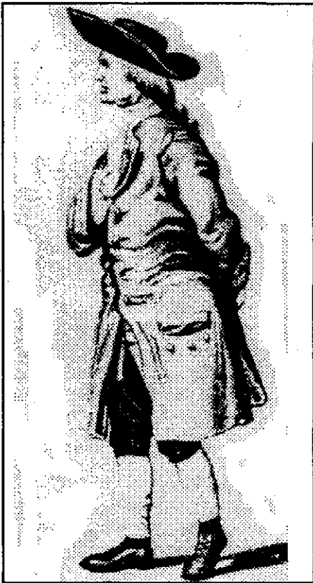
Henry Cavendish (1731 - 1810)

heliometru, dále svými měřeními změň hustoty a refrakce světla v atmosféře. Ve třicátých letech 18. století se zúčastnil francouzské výpravy, která měla za úkol změřit v Peru (v blízkosti rovníku) délku poledníkového stupně. V roce 1738 se Bouguer pokusil odhadnout hmotnost osamělé kuželovité sopky Chimboraza a zjistit, jak se na jejím úpatí odchyluje olovnice od svislého směru (asi o 7 úhlových vteřin).