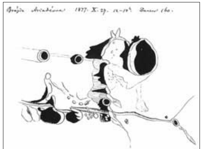
Šafaříkovy kresby útvarů na Měsíci